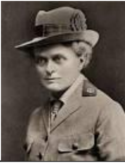
Elsie Maud Inglis

Il y a 100 ans le 1 er « Parliament Act » donnait le droit de vote aux femmes à condition qu'elles aient plus de 30 ans et qu'elles soient occupantes en titre de leur logement. Il avait fallu des années de campagnes, d'actions sur le terrain, de violences, de grèves de la faim de la part des suffragettes militantes pour arriver à ce résultat : le « Representation of the People Act » en 1918. Mais ce fut certainement l'énorme contribution durant la première guerre mondiale de ces femmes appartenant à toutes les classes sociales qui permit le vote final. Elsie Inglis en est la figure de proue.